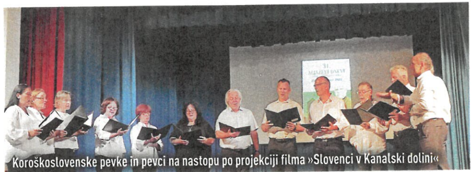
Koroškoslovenske pevke in pevci na nastopu po projekciji filma »Slovenci v Kanalski dolini«